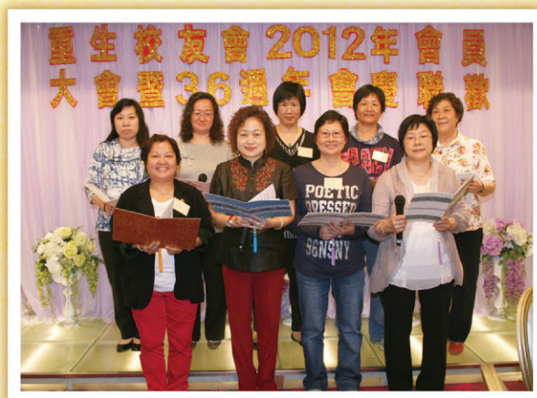
(粵曲小組在大會上獻唱)

最後校友懷著依依不捨的心情，與老師和校友合照，晚會在一片歡樂聲中結束！（註：當天活動照片已上載校友會網頁，歡迎校友瀏覽、下載。）